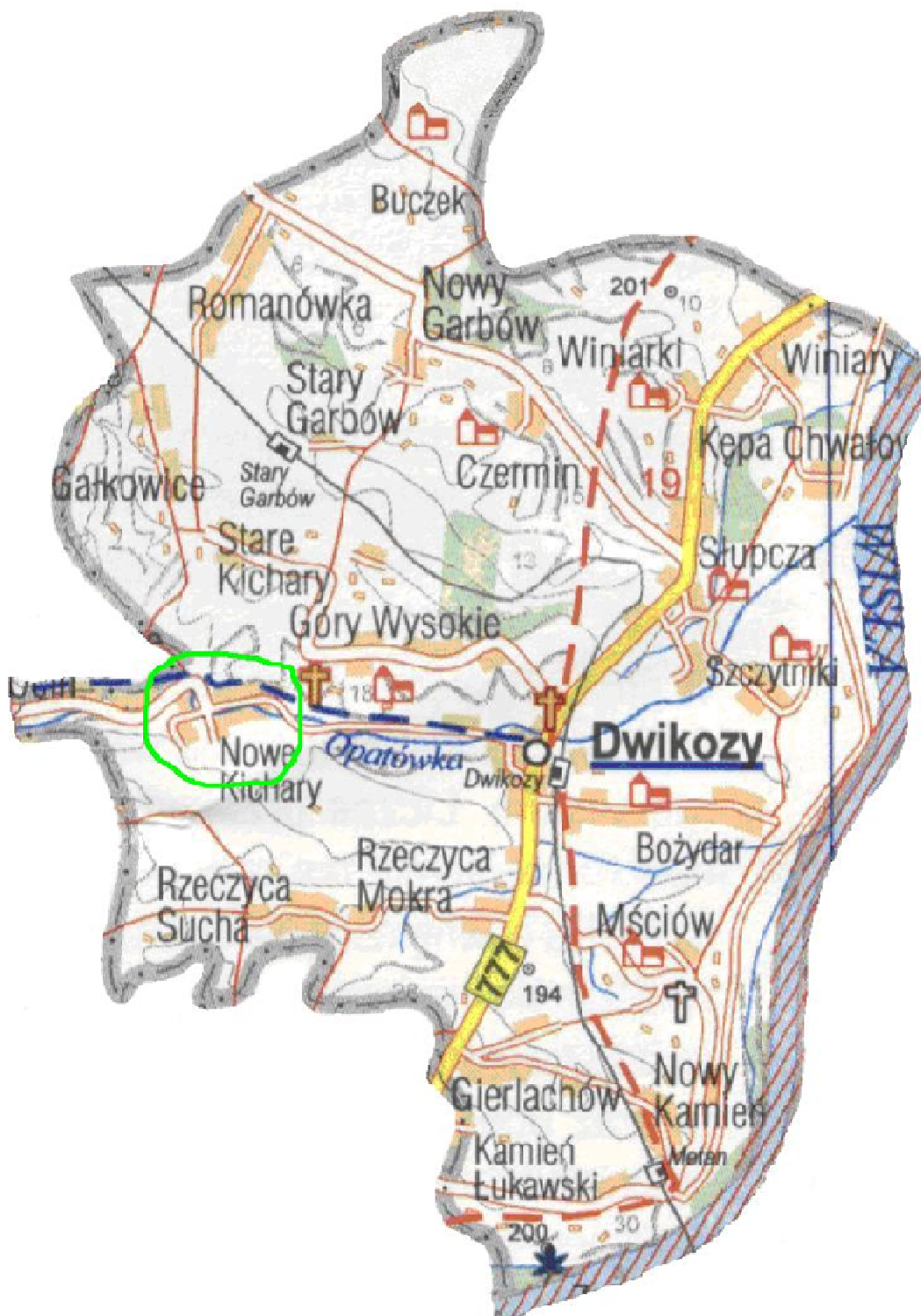
Rys 1. Nowe Kichary położenie na tle Gminy Dwikozy