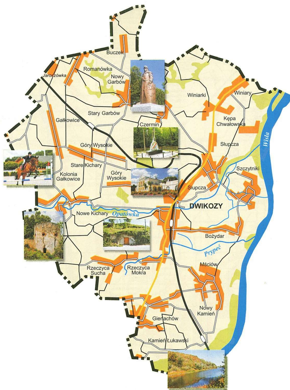
Mapa nr 1. Mapa Gminy Dwikozy

Lokalizacje poszczególnych miejscowości przedstawiono na poniższej mapie: